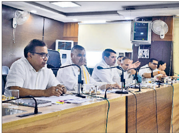
सोनीपत। बैठक के दौरान मंवासीन सांसद, विधायक, उपायुक्त, मेयर एवं अन्य।

संचालित योजनाओं की प्रगति की समीक्षा करते कुल 67 एजेंडों पर की चर्चा