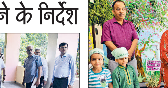
सोनीपत। बच्चों को पौधे वितरित करते प्राचार्या एवं अन्य।