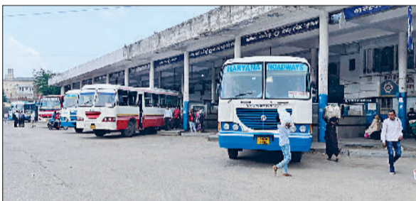
सोनीपत। बस परिसर में खड़ी बसें व मौजूद यात्री।

बता दें कि सोनीपत बस अड्डा में दो महीने में एसी की नौ नई बसें पहुंची हैं। इन बसों में टू प्लस टू सीटों की सिटिंग है। बसों में सफर करने