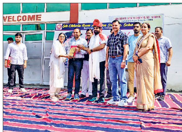
सोनीपत। कार्यक्रम में पहुंचे अतिथियों का स्वागत करते हुए।