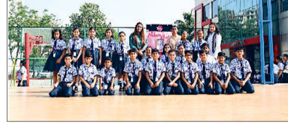
सोनीपत। ब्राइट स्कॉलर स्कूल में कार्यक्रम के दौरान विद्यार्थियों के साथ स्टाफ।